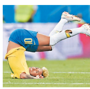
尼馬在對瑞士一役跌倒。法新社

足協18日致信國際足協，質疑在巴西的世界盃首秀對瑞士一役為何未使用VAR（視頻助理裁判）系統。 巴西足協表示，裁判存在兩次明顯誤判，應該通過VAR視頻分析後再做判罰決定。巴西足協還要求國際足協說明VAR的使用準則，並質疑為何這場比賽VAR沒有介入裁判的判罰。同時希望國際足協能就此問題作出官方解釋。 香港文匯報記者 陳曉莉