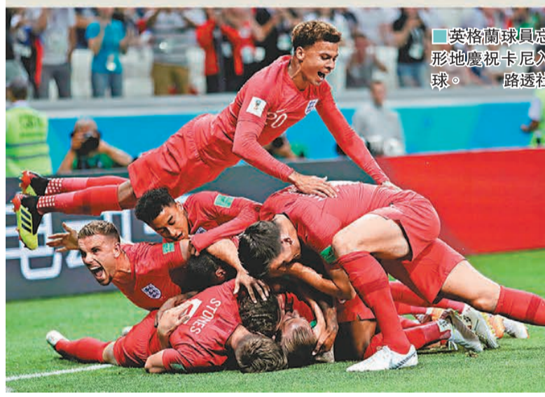
英格蘭球員忘形地慶祝卡尼入球。

去季英超神射手爭持激烈，一直落後於沙拿的哈利卡尼為追趕對手，去信英足總表示艾歷臣對沙拿的入球實為自己所入，更以親生女兒性命起誓絕無虛言。雖然最終上訴得直，不過哈利卡尼該次舉動卻惹來全英以至世界各地球迷瘋狂“抽水”，連英足總亦曾在社交網站上嘲笑這位自家國家隊射手，比起前輩舒利亞、奧雲以至朗尼，哈利卡尼在本土球迷心中的地位實在難以相比。 不過時至今日，英格蘭球迷已經明白球隊在世界盃有所突破甚至挑戰冠軍，哈利卡尼絕對是不可或缺的球員。這位25歲射手今場展示出色的埋門觸覺，於補時階段協助英格蘭以2:1絕殺突尼西亞取得寶貴3分，而隊友史達寧及連格今場糟糕的埋門質素，更顯出哈利卡尼的射術可貴，賽後網絡上對哈利卡尼一片讚頌之聲，與個多月前相比簡直是天堂與地獄，連突尼西亞的主教練馬亞爾亦被他的表現所折服，大讚卡尼是英超最強的前鋒之一，決定了今場的勝負。 而英格蘭主帥修夫基未知是否知道哈利卡尼早前對英足總心存芥蒂，表示卡尼會感受到帶領英格蘭於世界盃取勝的榮譽感，似是希望這位王牌射手放下恩怨繼續專心為球隊爭勝。 向來對神射手充滿情意結的哈利卡尼當然不會放過成為世界盃金靴獎得主的机会。曾表示希望大演帽子戲法追趕C朗拿度的他滿意自己今場演出，並會繼續以成為“球王”為目標：“我時刻都想證明自己，在適當時候挺身而出，這兩個入球增強了我的信心，我希望接下來能夠保持好狀態，當然我還有很長的路要走，我的目標是成為世界上其中一名最好的球員，就像C朗拿度或美斯那樣。”