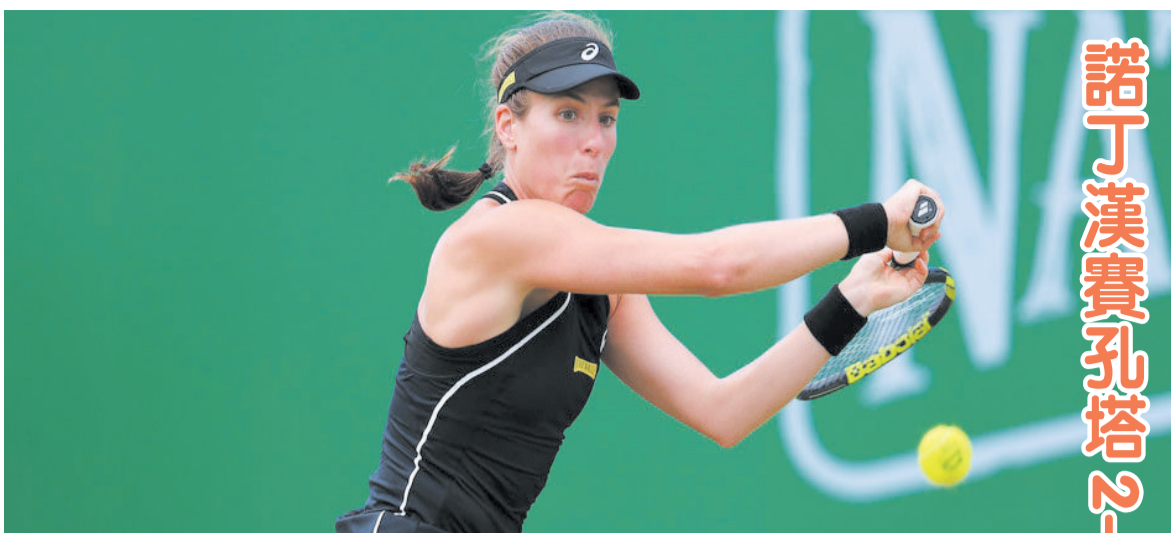
諾丁漢賽孔塔 N.O. 沃特森