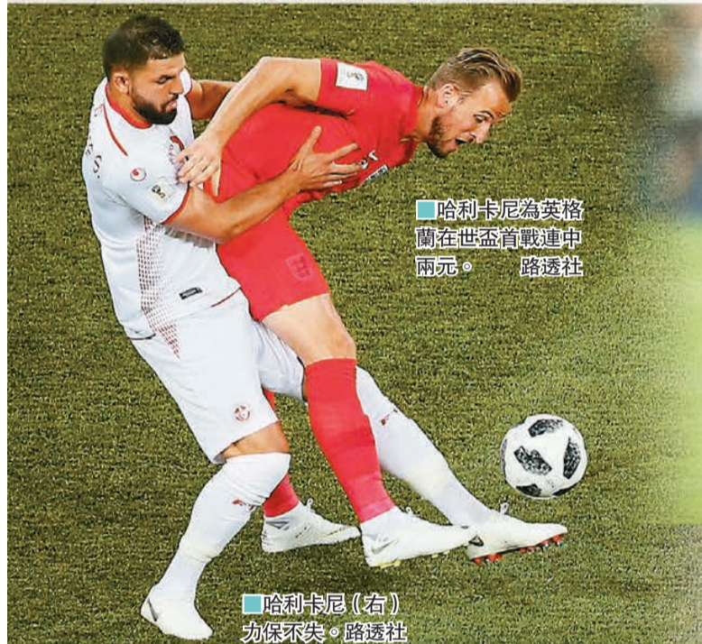
哈利卡尼為英格蘭在世盃首戰連中兩元。