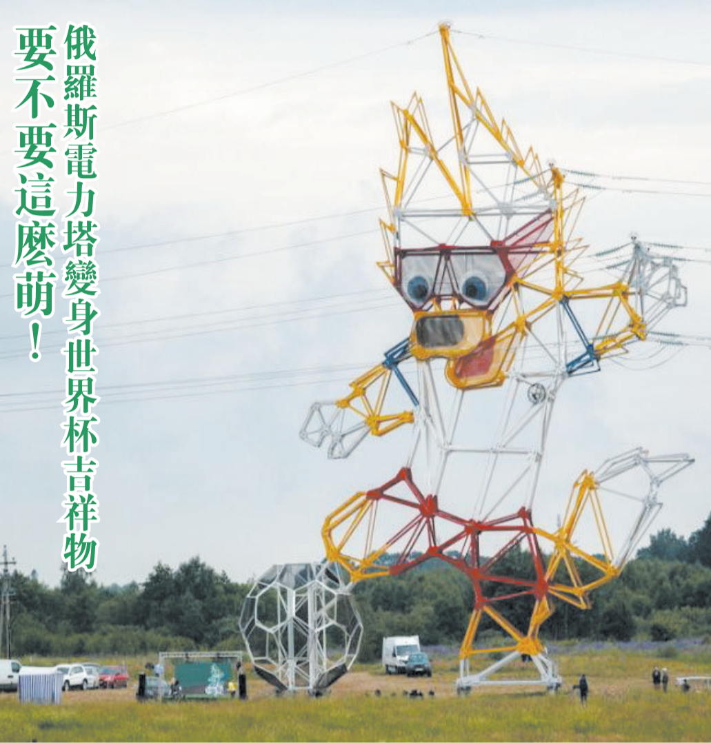
俄羅斯電力塔變身世界杯吉祥物 要不要這麼萌!