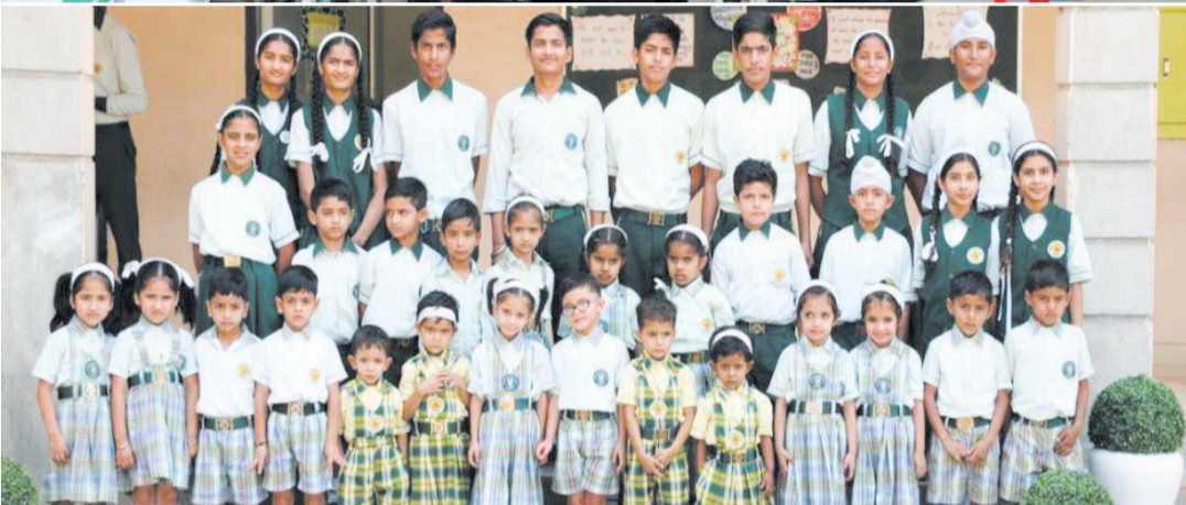
在印度旁遮普邦帕坦科特，有壹所十分特別的學校，17對雙胞胎讓這所公立學校遠近聞名。...